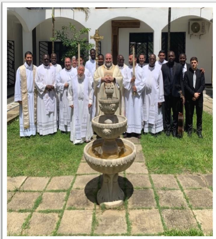
Fig. 8 e 9 – A sinistra la messa con i presbiteri per l'anniversario del seminario; a destra la foto nel cortile del seminario.