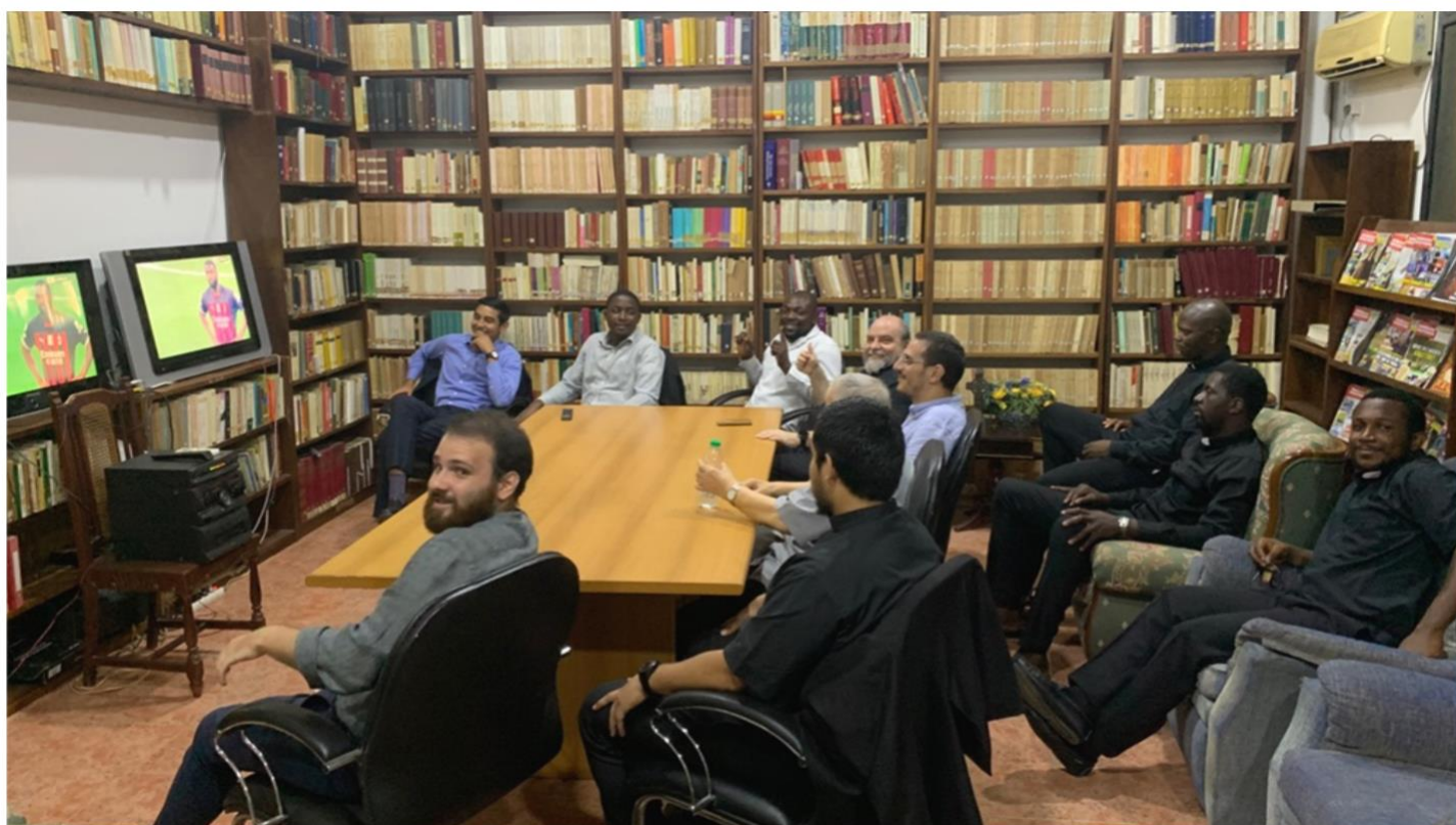
Fig. 10 e 11 – Qui sopra, in seminario, guardando la partita della Champions. In basso la messa di ordinazione presbiterale.

Il 17 maggio il vescovo ha ordinato 6 nuovi presbiteri e 1 nuovo diacono, per la diocesi di Douala, e il seminario ha partecipato alla liturgia e alla festa. Una bella usanza della chiesa locale di Douala è che dopo le ordinazioni il vescovo offre una bella agape (un pranzo tutti insieme) nel vescovado.