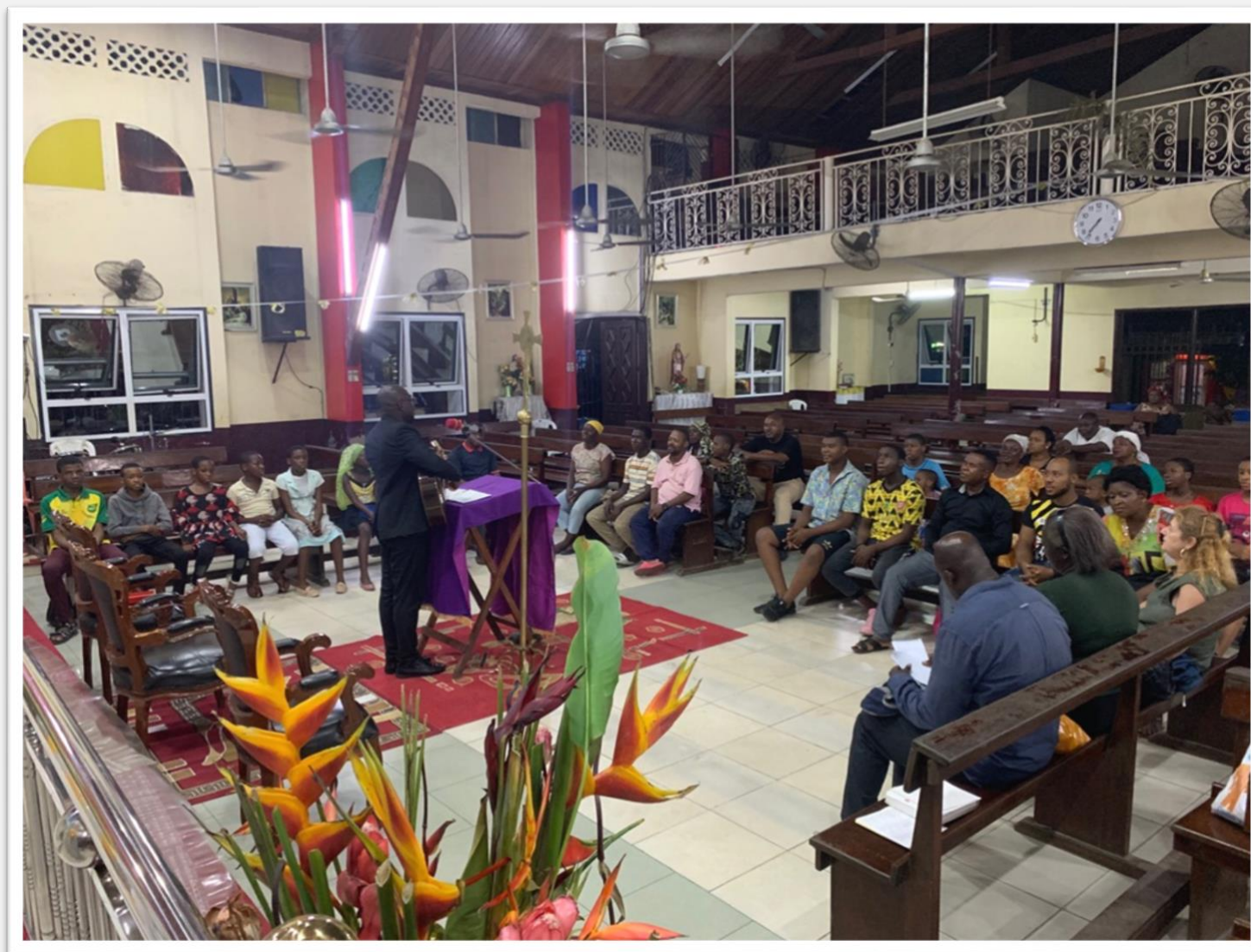
Fig. 4 – Qui sopra un momento liturgico durante le catechesi in inglese con la parrocchia di Holy Trinity, in chiesa.