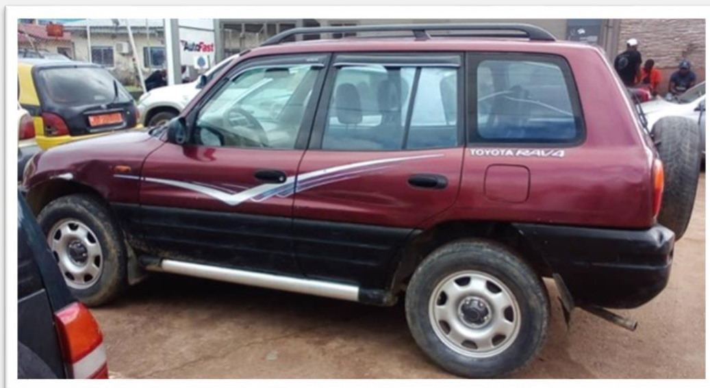
Fig. 21,22 e 23 – Qui sopra e nell'altra pagina le 3 "nuove" Toyota che abbiamo comprato questo mese: diciamo nuove per noi, non in se stesse, ma speriamo che facciano la loro funzione.